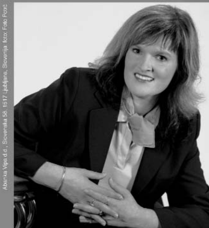
Abanka Vip d.d., Sovarčeva 55, 1517 Ljubljana, Slovenija.